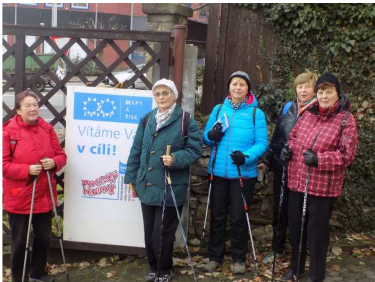
Zapsal Vladimír Hejnic