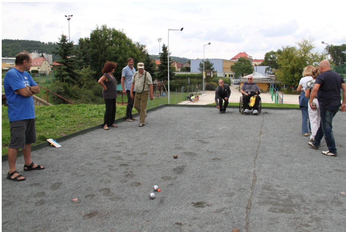
SOUBOJ STŘELCE A NAHAZOVAČKY.