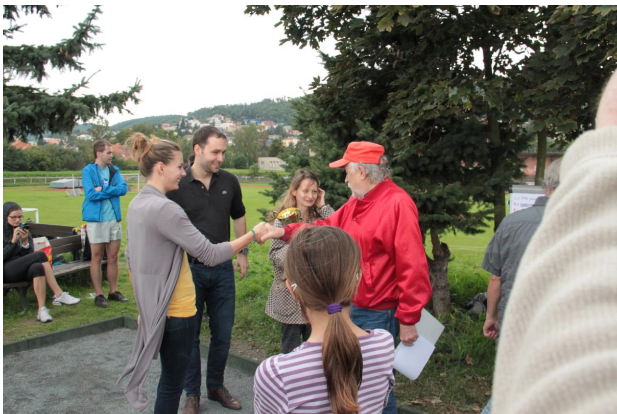
VÍTĚZNÁ TROJICE S POHÁREM A V AKCI PŘI ZÁPASE.