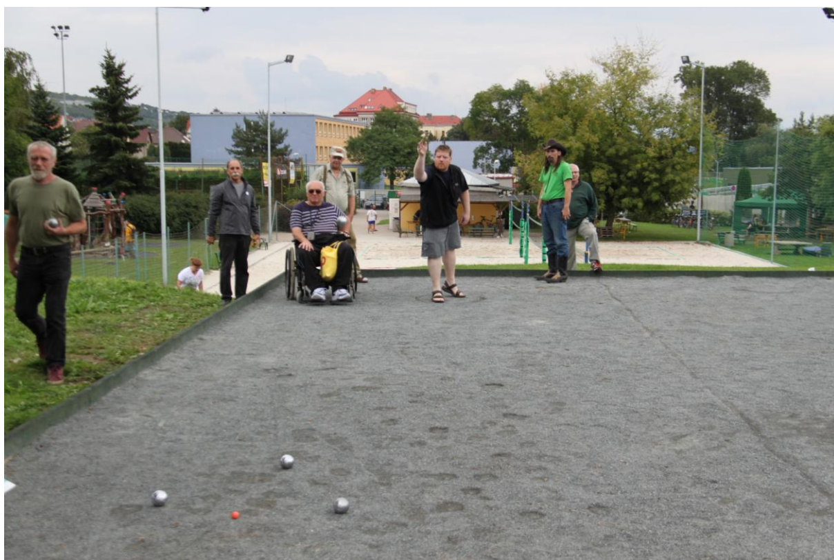
III. KOLO SEŠLOST VĚKEM - KSŘ B 13:3.SOUPEŘ BYL NAD NAŠE SÍLY.