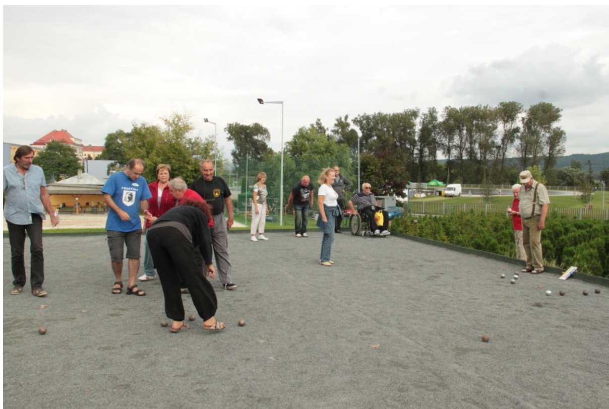
II.KOLO KSŘ „B“ PRAHA 17 - RADOST PRAHA 16 13:12. VÝSLEDEK PO NESKUTEČNĚ VYROVNANÉM BOJI USPOKOJIL OBĚ SEN. DRUŽSTVA.