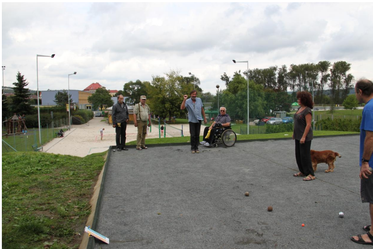
NAŠI PRVNÍ SOUPEŘI V I.KOLE. KSŘ B – BURČÁK 13:11.