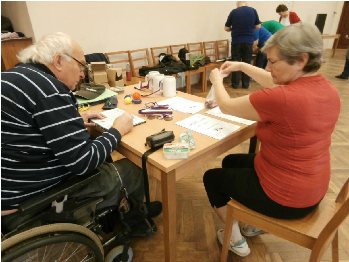
KAŽDÝ TURNAJ MÁ SVÉ ORGANIZAČNÍ PRACOVNÍKY.