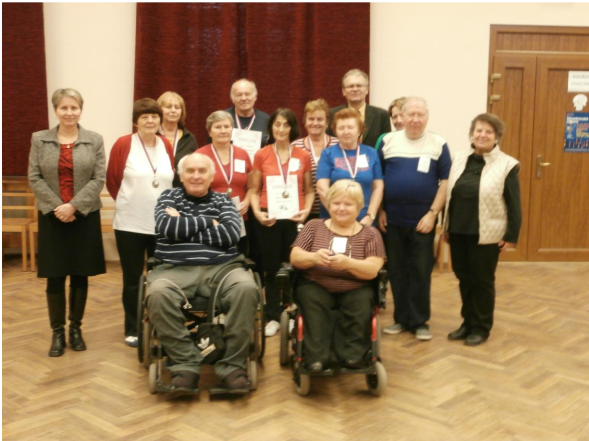
ZÁVĚREČNÉ FOTO, VELMI ZDAŘILÉ SENIORSKÉ AKCE V PETANQUE.