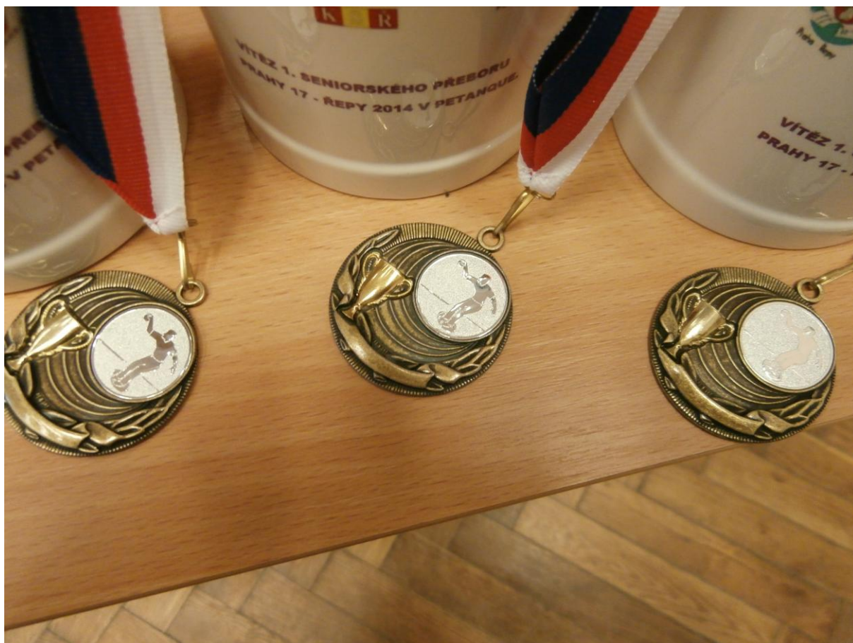
POHÁRY S LOGY TŘÍ POŘADATELŮ A MEDAILE PRO VÍTĚZE TURNAJE.