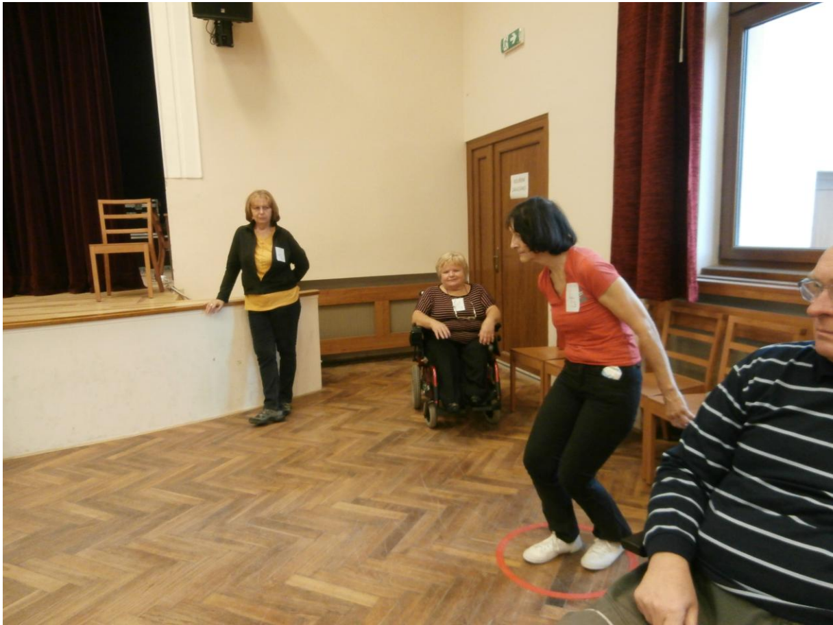
MAXIMÁLNÍ SOUSTŘEDĚNÍ ZKUŠENÉ JIŘINKY. JEN 1:0 PRO ČERNÉ.