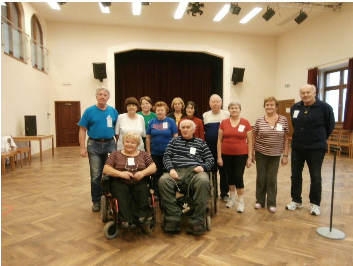
ÚČASTNÍCI 1. PŘEBORU ŘEP V PETANQUE 2014. 1. KOLO SE LOSUJE.