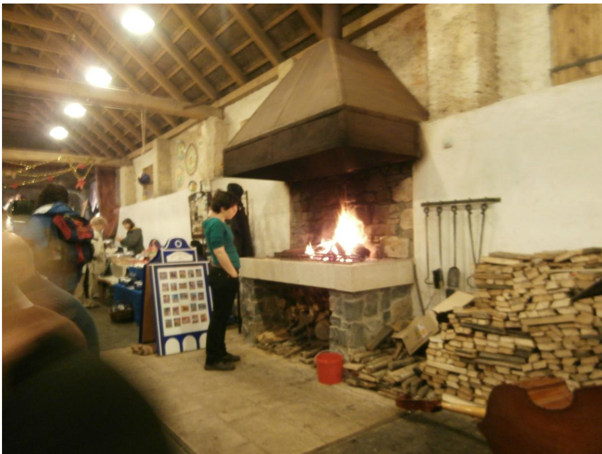
V trhovní stodole bylo příjemné teplo a nádherně vonělo pálené dřevo.