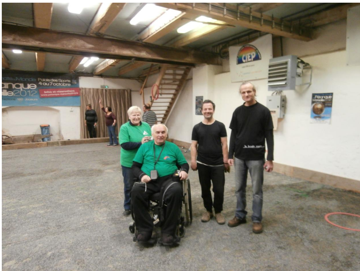
O generaci mladší soupeři z Drážďan. Unětické pivko za dvacku, chutnalo.