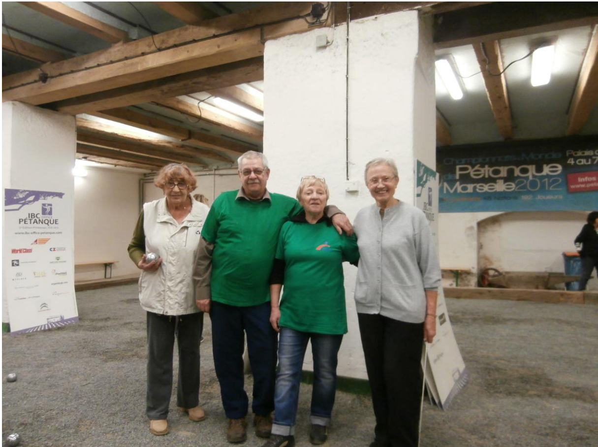
Naše čtyři soupeřky z Prahy 1, z Mekky pražského seniorského petanque.