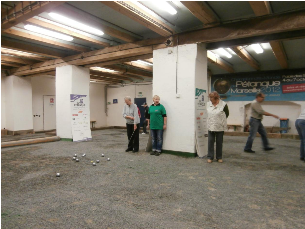
Seniorkám z Prahy 1, jsme vrátili i s úroky naše loňské porážky.