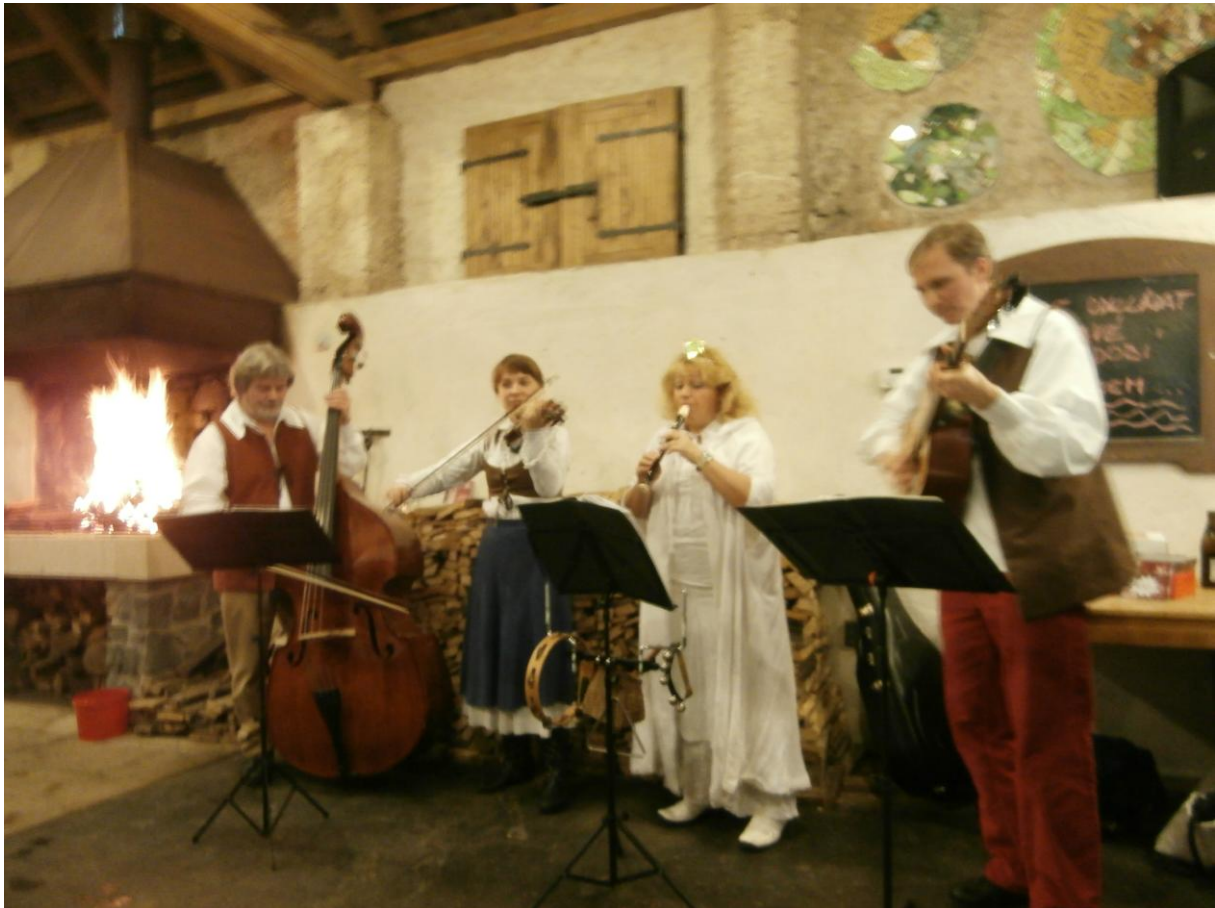
V Unětické stodole byly trhy i s předvánoční hudbou a dobrou baštou.