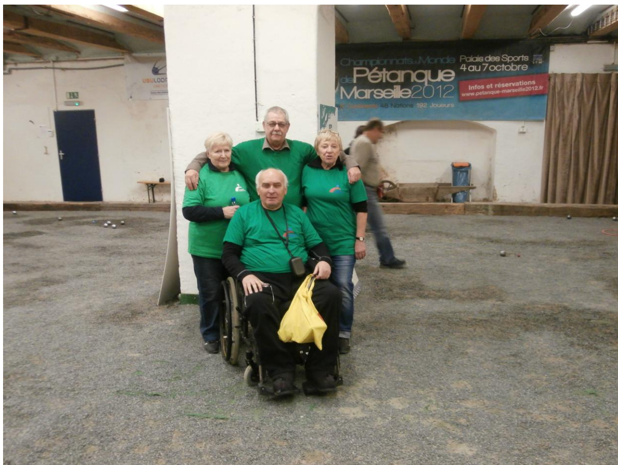
První výhra KSŘ B Prahy 17, 2:0, v obou čtyřhrách, nás velmi potěšila.