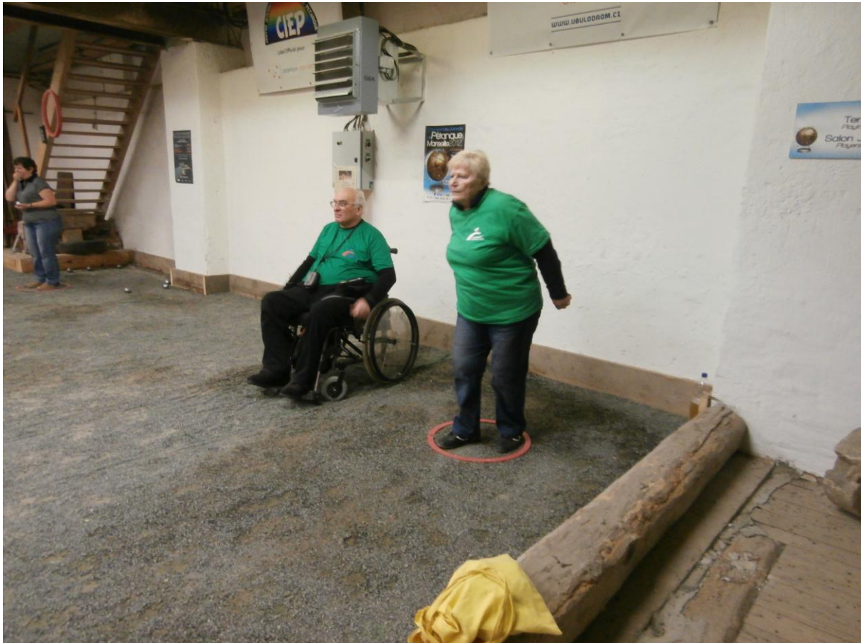
První mezinárodní utkání jsme prohráli s mladými Němci z Drážďan