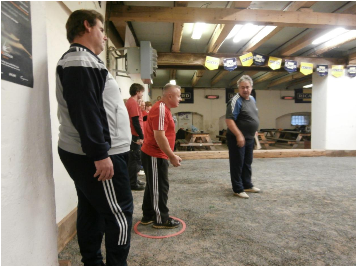
Tito mladí Jůrové, nás čekají v neděli 11. ledna 2015 ve třech zápasech.