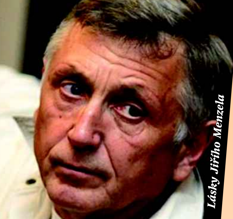
Lásky Jiřího Menzela