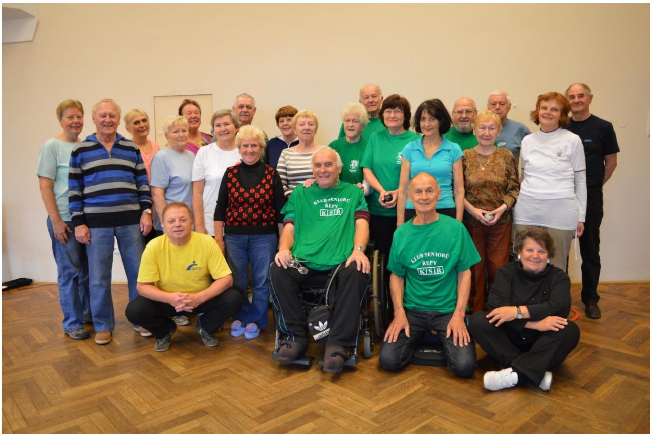
ÚČASTNÍCI LISTOPADOVÉHO SENIORSKÉHO TRENINKU INDOOR PÉTANQUE V SOKOLOVNĚ ŘEPY.