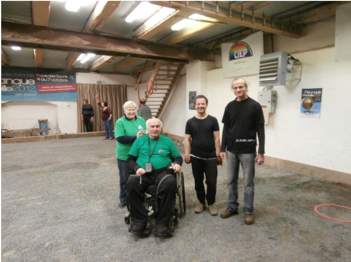
O generaci mladší soupeři z Drážďan. Unětické pivko za dvacku, chutnalo.