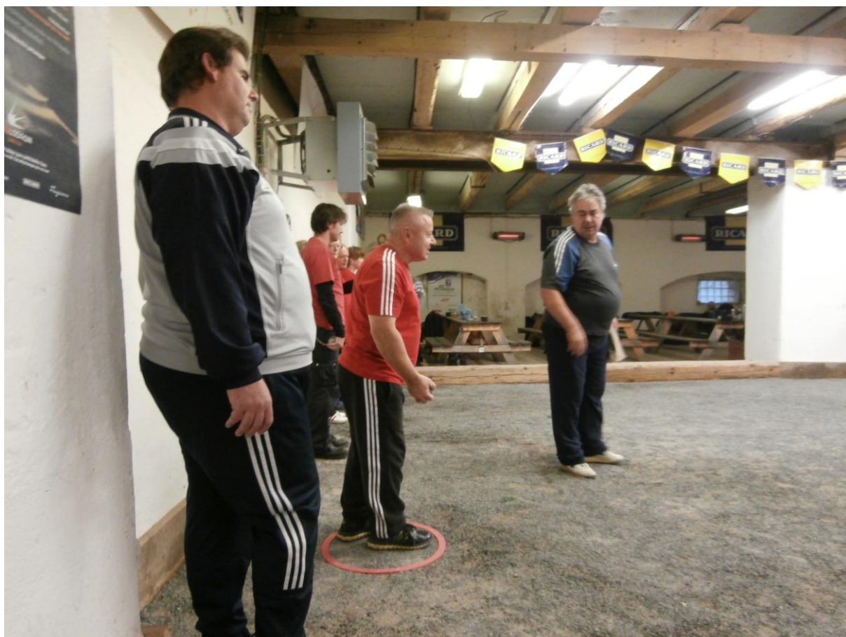
Tito mladí Jůrové, nás čekají v neděli 11. ledna 2015 ve třech zápasech.